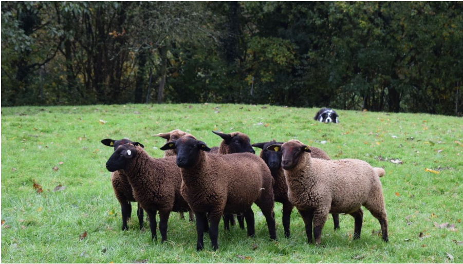
Schäferei Hennemann