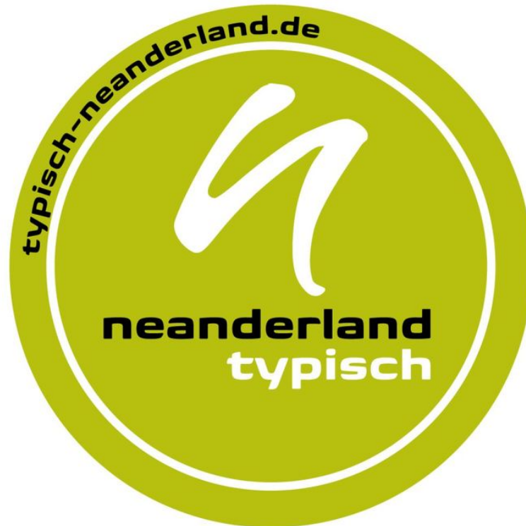
TYPISCH neanderland Siegel

Samstags 10 – 12 Uhr nach tel. Vereinbarung