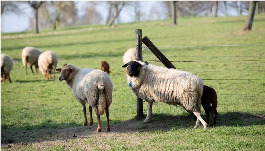
Schäferei Lamberti in Velbert