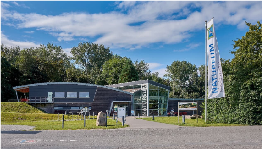
Natureum Niederelbe - © Tourismusverband Landkreis Stade e.V.