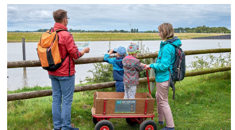
Familie unterwegs im Natureum Niederelbe