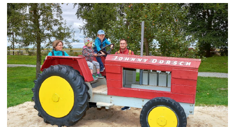
Familie auf dem Spielplatz im Natureum