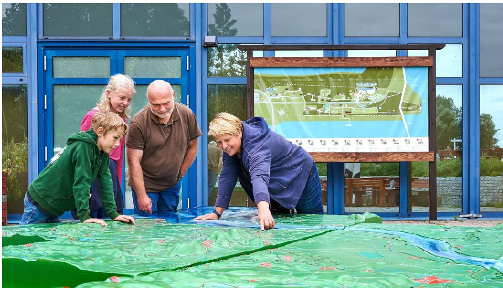
Familie schaut sich Plan im Natureum an

Sommer (17.03.-03.11.) Di - So und feiertags 10:00 - 18:00 Uhr Juli und August auch montags geöffnet Winter (04.11.- 01.12., 07.01.-29.02.) Sa und So 10:00 - 17:00 Uhr 02.12. - 03.01. geschlossen