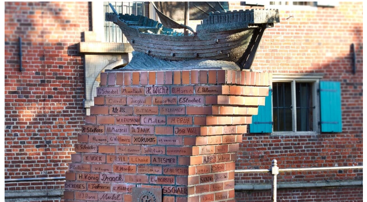
Hansekogge vor dem Schwedenspeicher