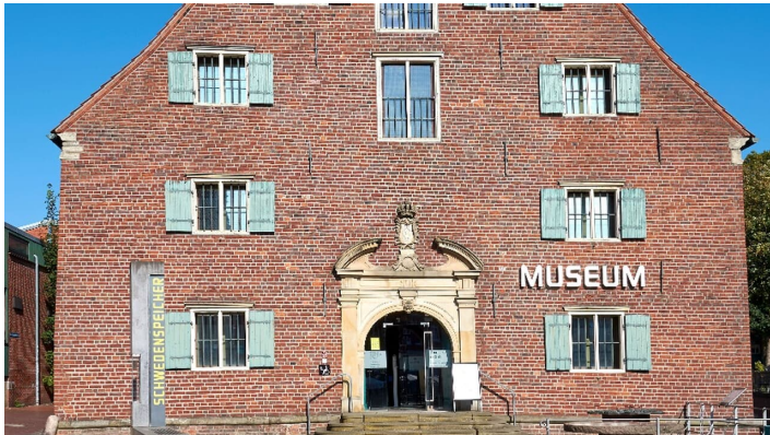
Museum Schwedenspeicher

Di - Fr 10:00 – 17:00 Uhr Sa und So 10:00 – 18:00 Uhr