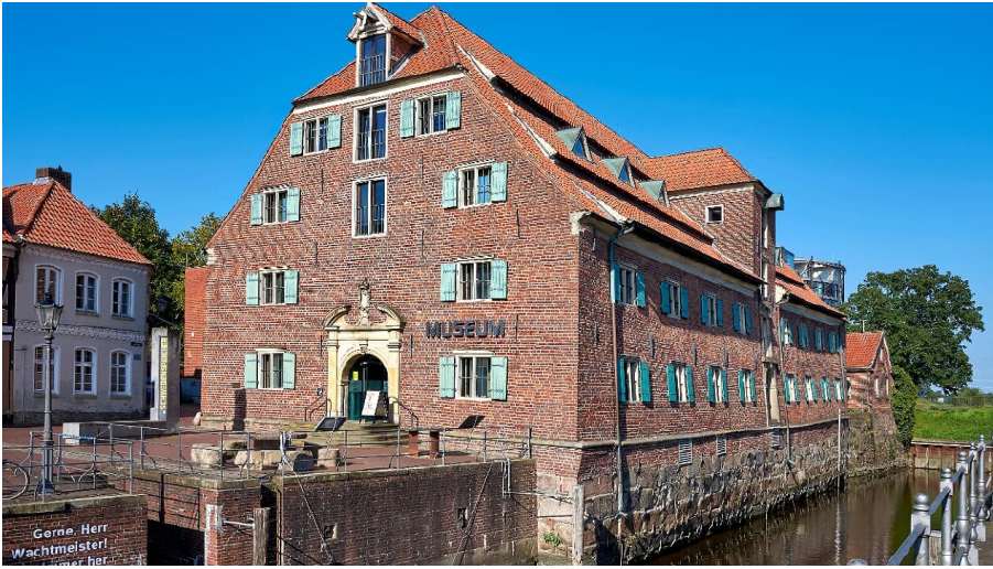
Museum Schwedenspeicher