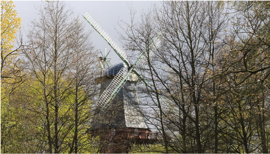
Windmühle am Schiffertor in Stade