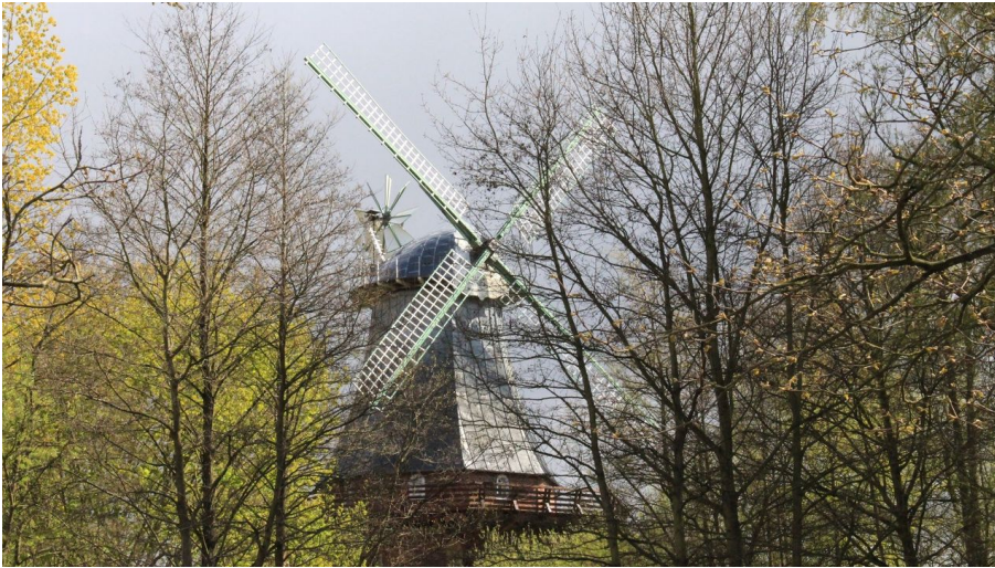
Windmühle am Schiffertor in Stade