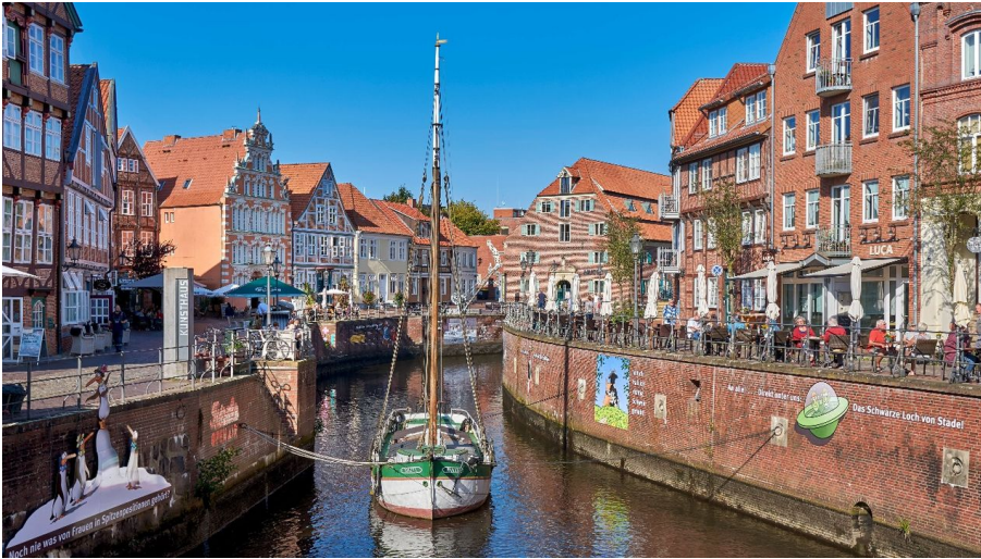
Stader Hansehafen