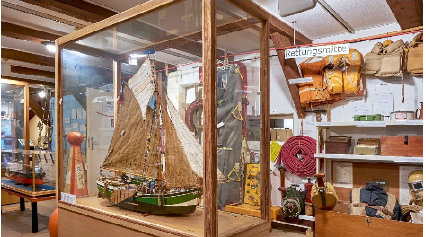
Impression Ausstellung Kehdinger Küstenschiffahrts-Museum in Wischhafen - © Tourismusverband Landkreis Stade e.V., Unbekannt