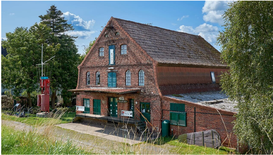
Kehdinger Küstenschiffahrtsmuseum