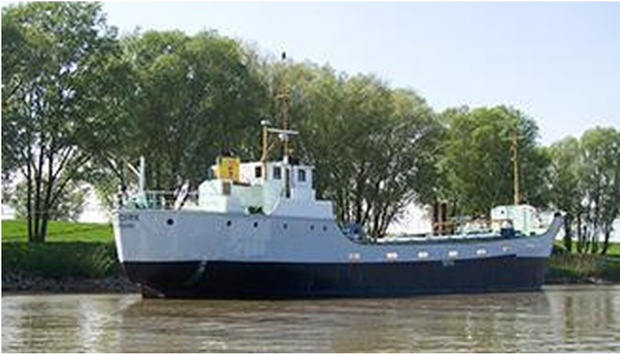
Kümo Jan-Dierk

Das denkmalgeschützte fahrbereite Küstenmotorschiff (Kümo) der Bauart Weselmann wurde 1950 in Cuxhaven gefertigt. Im Sommer ist es im Hafen Krautsand-Ruthenstrom zu besichtigen.