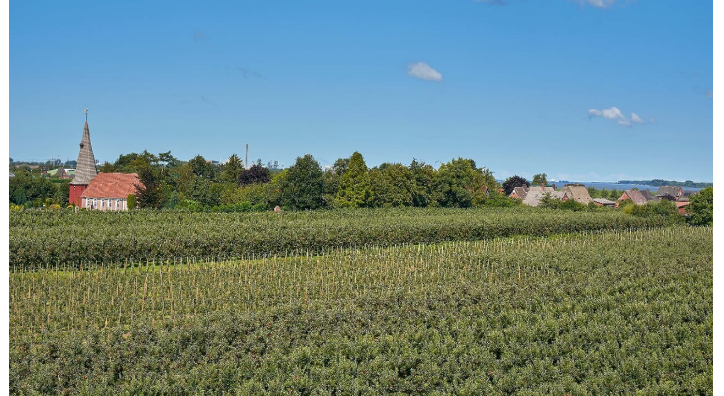
Aussicht von der Windmühle