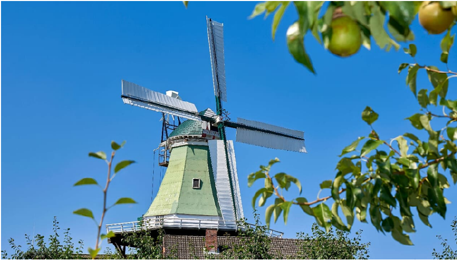
Windmühle Venti Amica