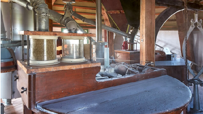
Mühle Venti-Amica