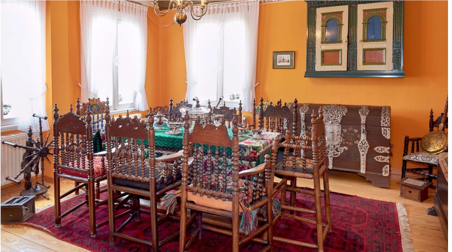
Impression Ausstellung Museum Altes Land