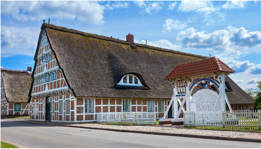
Außenansicht Museum Altes Land mit Altländer Prunkforte

Das Museum "Altes Land" in Jork ist in einem prunkvollen Altländer Fachwerkhaus untergebracht.