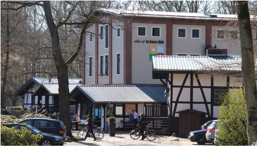
Deinster Mühle