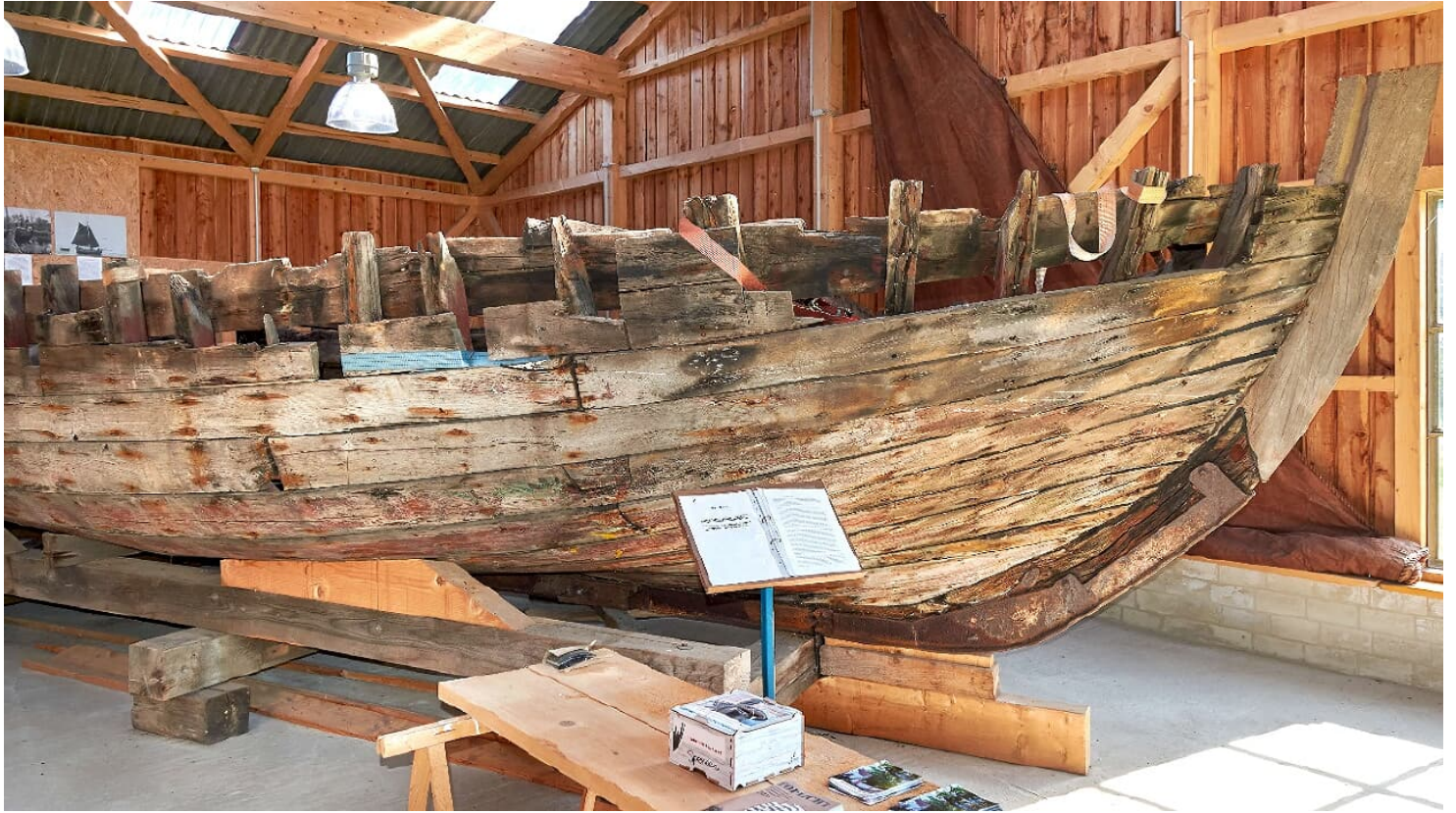
Jolle im Handwerksmuseum Horneburg