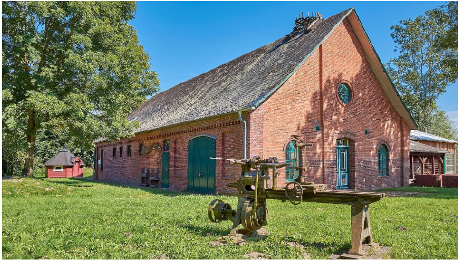
Handwerksmuseum Horneburg