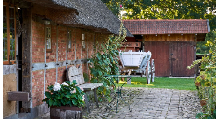
Bäuerliches Hauswesen Bliedersdorf