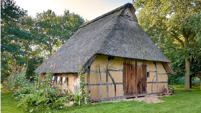
Bäuerliches Hauswesen Bliedersdorf