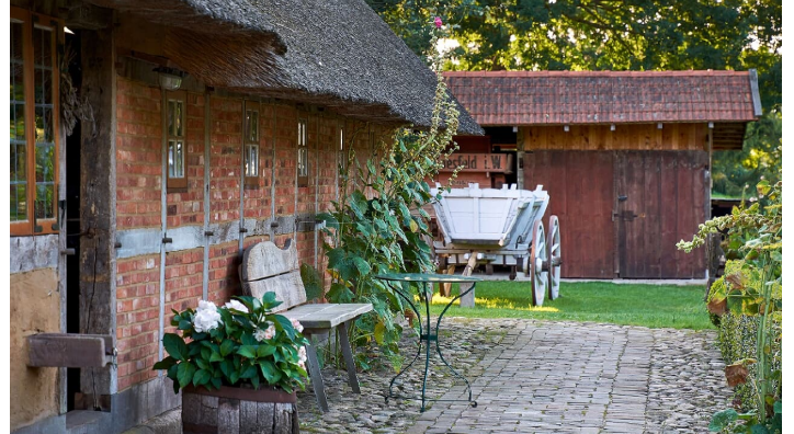
Bäuerliches Hauswesen Bliedersdorf