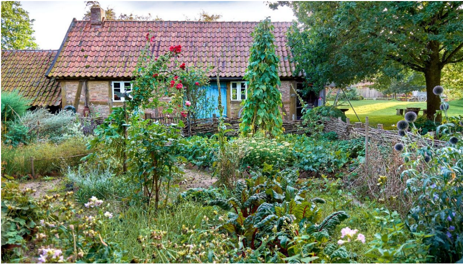
Bäuerliches Hauswesen Bliedersdorf