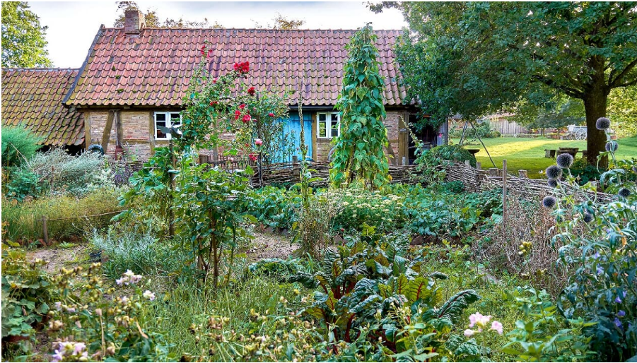
Bäuerliches Hauswesen Bliedersdorf