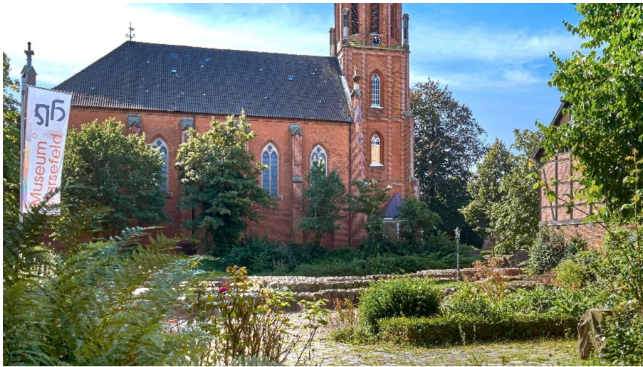
St. Marien und Bartholomäi Kirche Harsefeld