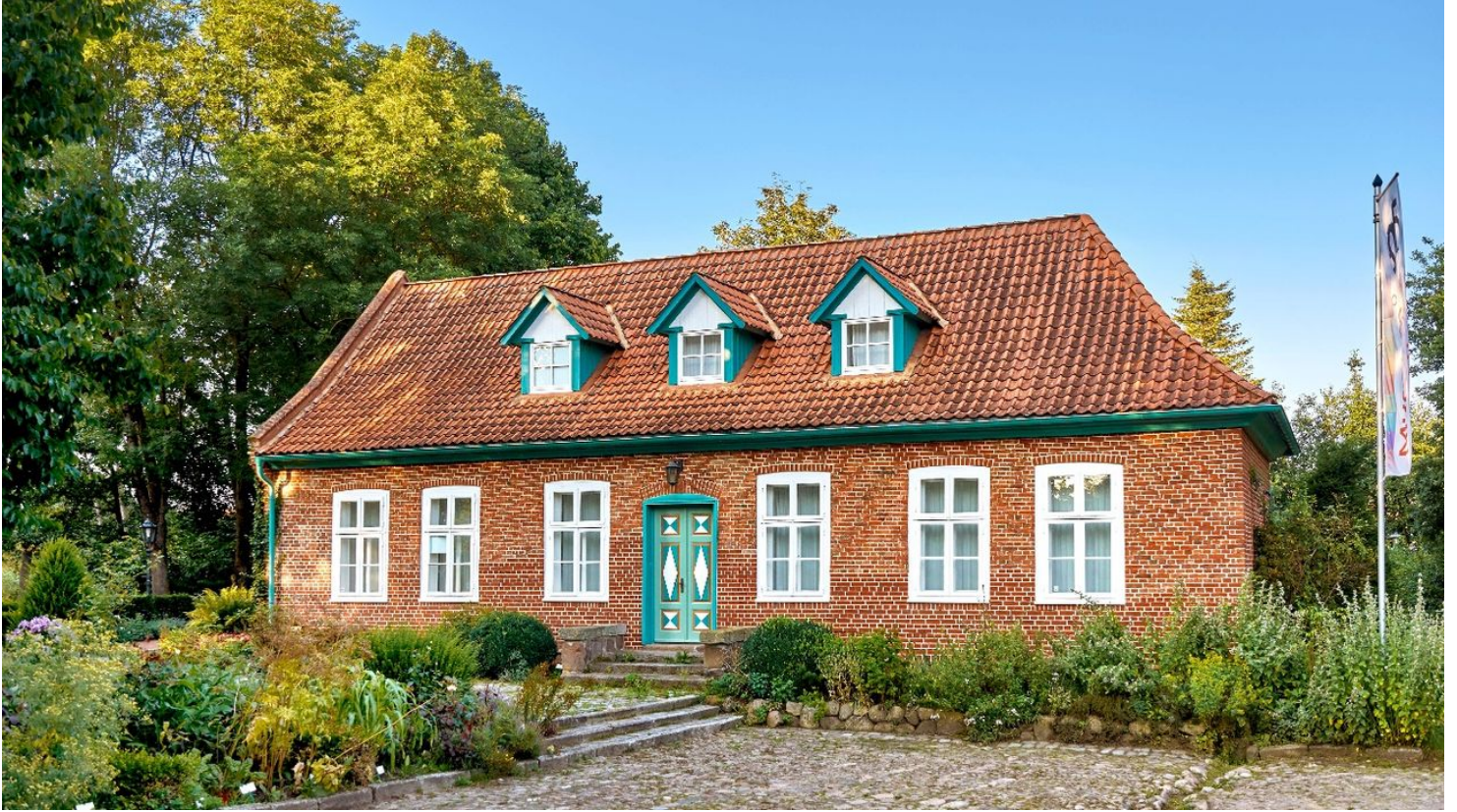
Museum Harsefeld