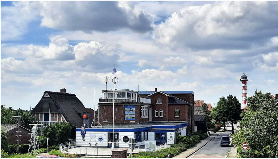
Außenansicht der Maritimen Landschaft - © Tourismusverband Landkreis Stade e.V., Unbekannt