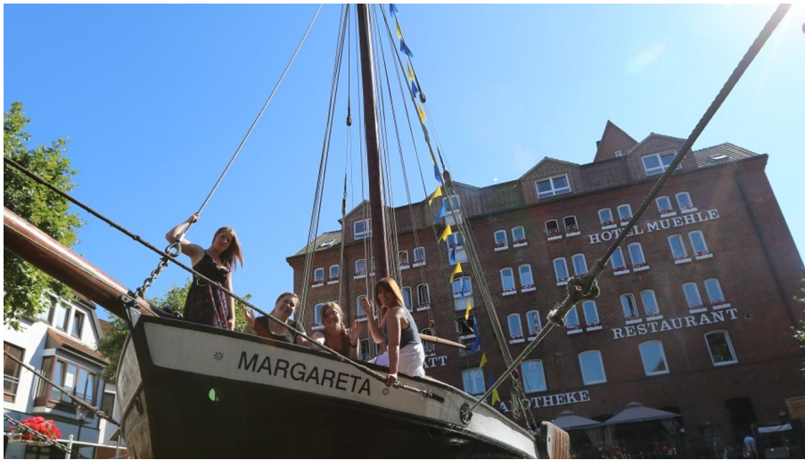
Ewer Margareta - Mühle Hansestadt Buxtehude