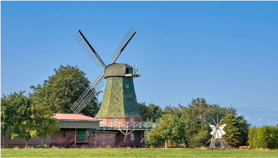
Windmühle Anna Maria

Windmühle Anna Maria (1843); Galerieholländer, Museumsmühle, vier Ebenen, restauriert 1984/85; Ausstellungen, Mühlen- und andere Feste; Führungen möglich.