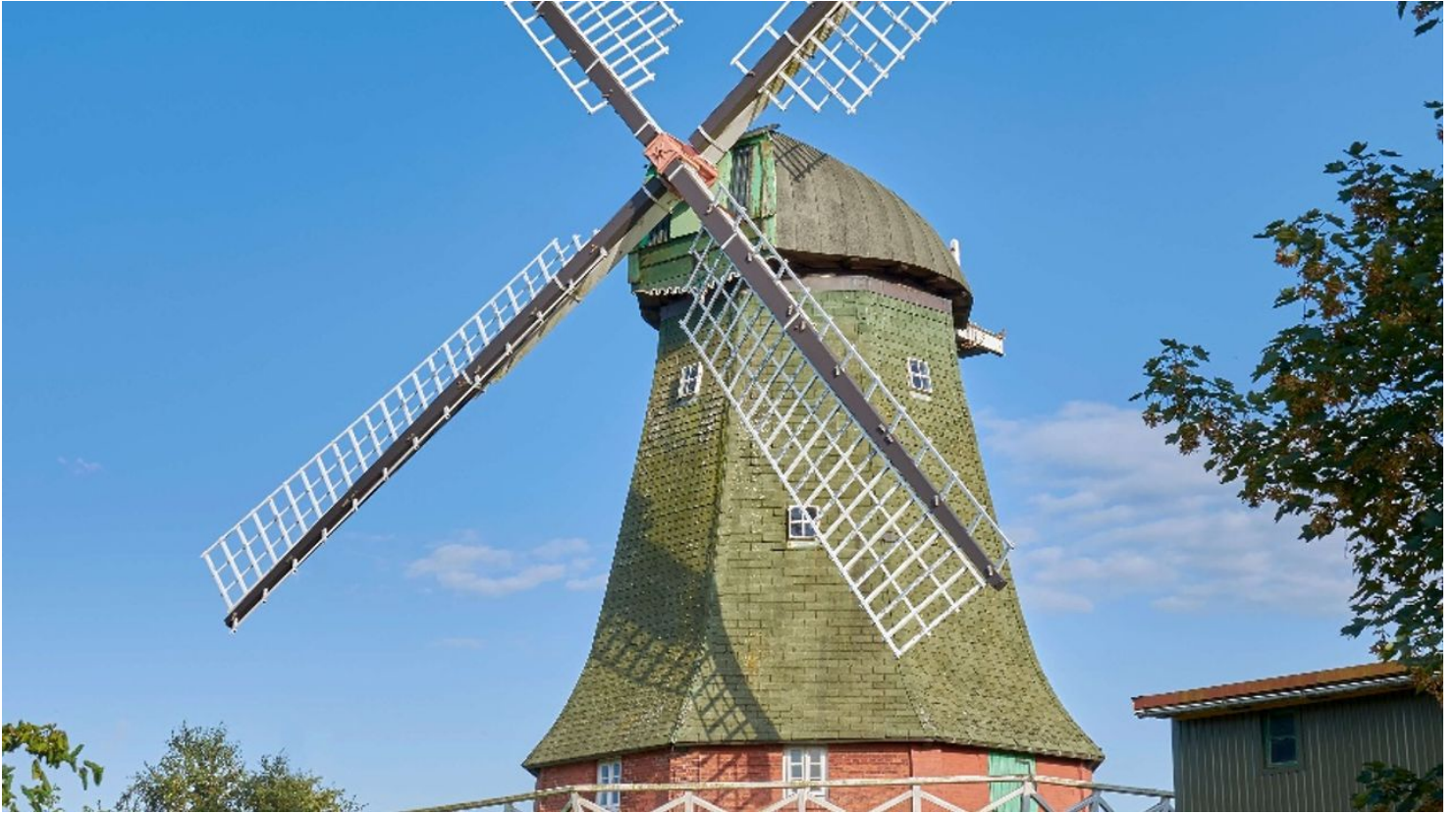
Windmühle Anna Maria