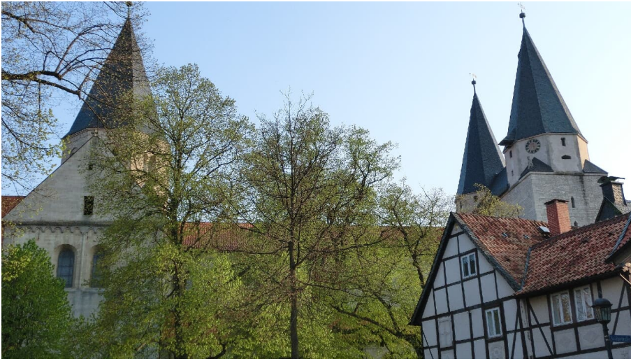
Kaiserdom Königsutter am Elm