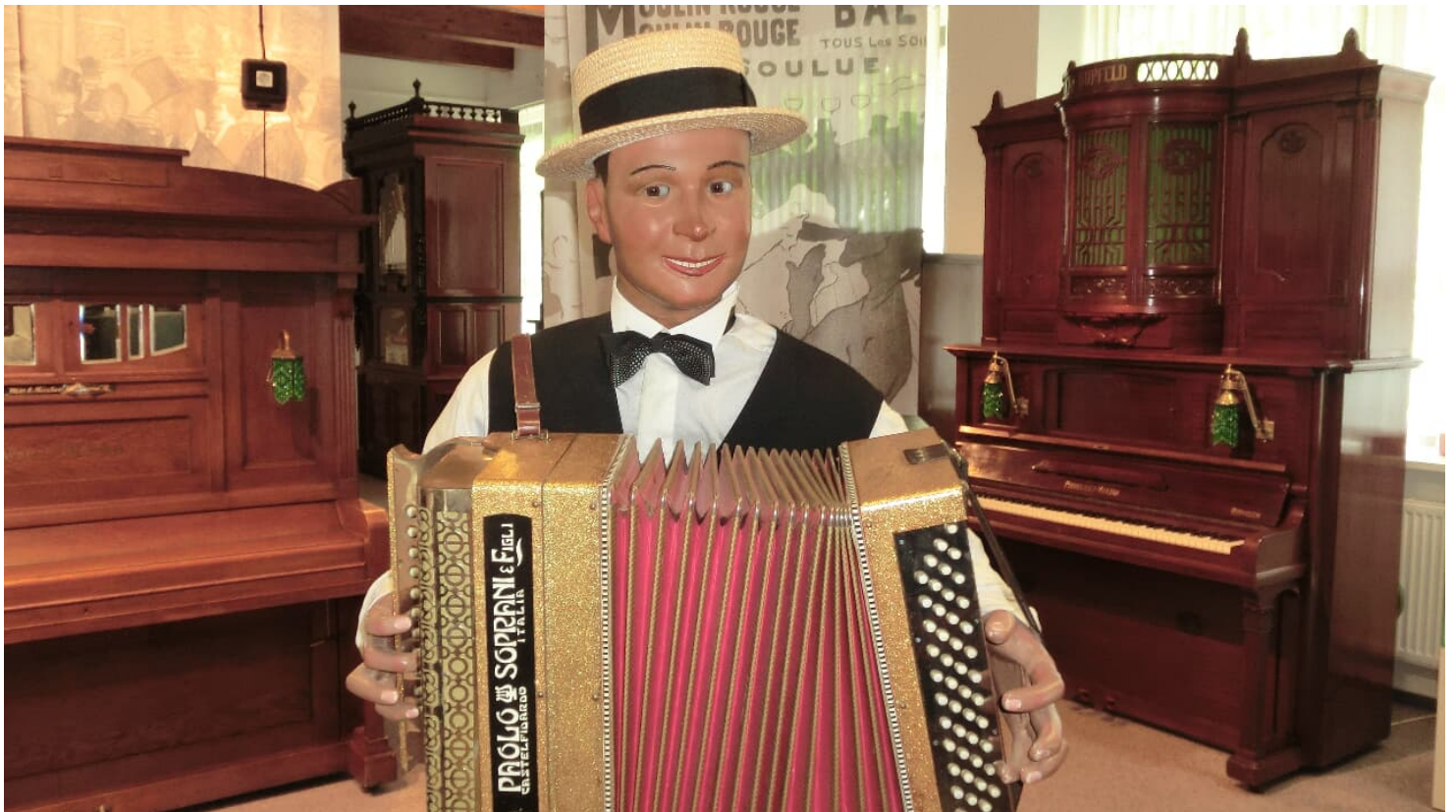
Museum Mechanischer Musikinstrumente 1

Di. - So.: 11 – 17 Uhr Gruppen nach Vereinbarung