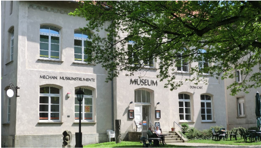
Museum Mechanischer Musikinstrumente