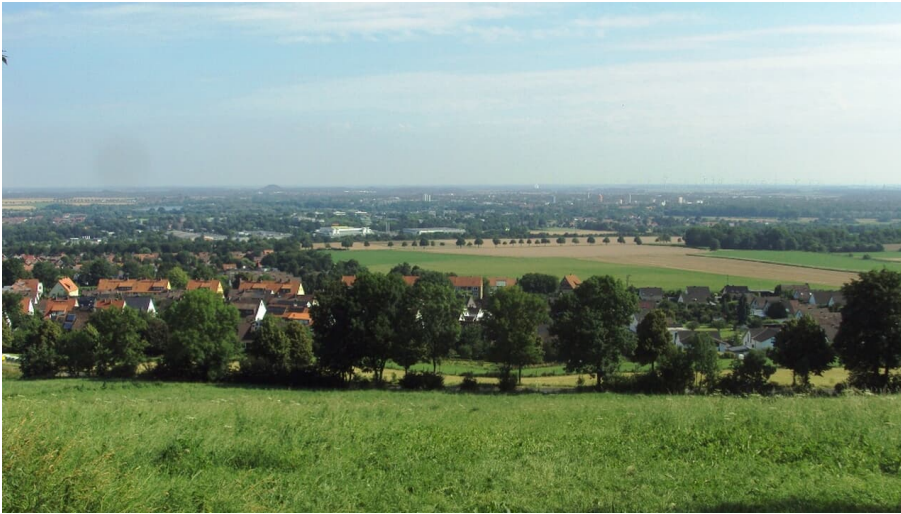
Salzgitter-Lichtenberg, Ausblick von der Kanzel am Wanderparkplatz im Höhenzug