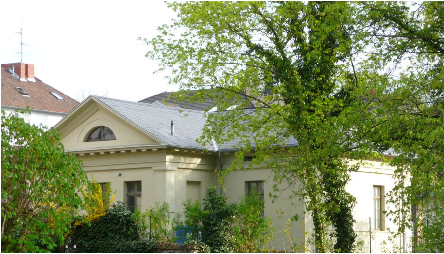
Museum für Photographie Braunschweig - © Jan-Christoph Ahrens, Netzwerk ZeitOrte, ZeitOrte