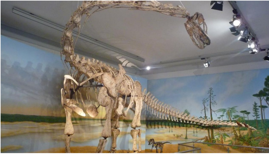
Staatliches Naturhistorisches Museum Braunschweig