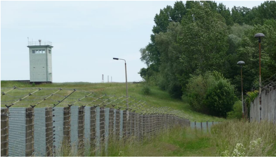
ehemaliger Grenzübergang - Grenzenlos - Wege zum Nachbarn e.V.