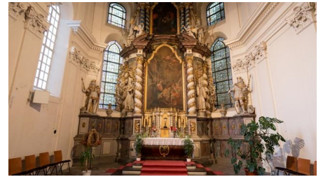
Altarraum der Klosterkirche Ringelheim