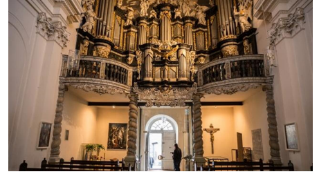
Barockorgel in der Klosterkirche Ringelheim