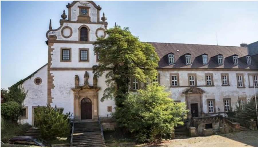
Klosterkirche Ringelheim