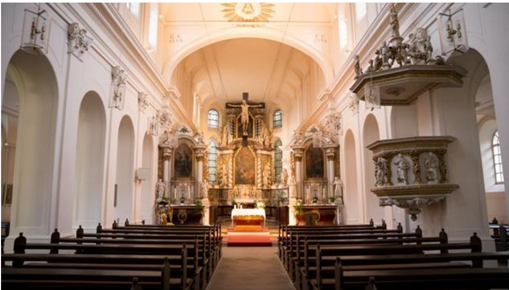
Innenraum der Klosterkirche Ringelheim