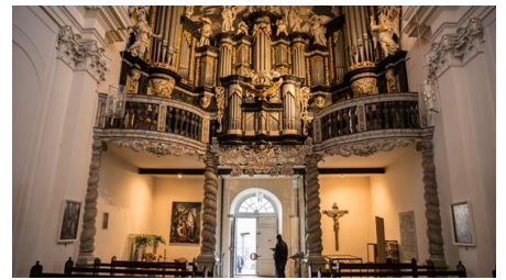
Barockorgel in der Klosterkirche Ringelheim