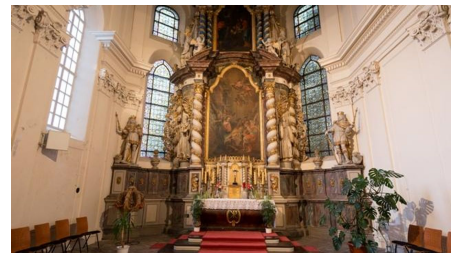
Altarraum der Klosterkirche Ringelheim - © Andre Kugellis, Tourist-Information Salzgitter