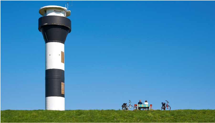
Leuchtturm in Twielenfleth