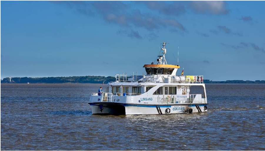
elblinien - Fähre Liinsand