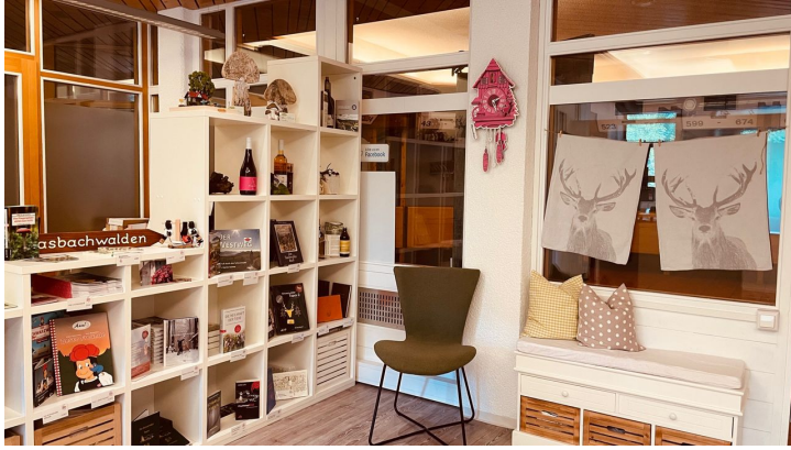
Copyright Tourist Info Sasbachwalden 3 - © Tourist-Info Sasbachwalden