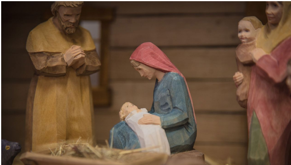
Traditionelle Krippenfiguren - Christnacht von Huggler Holzbildhauerei