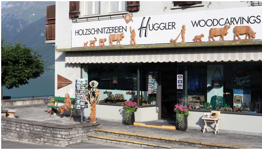
Huggler Holzbildhauerei, Traditionshandwerk in Brienz