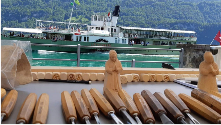
Meissel und Figuren, Blick auf den Quei und Brienersee mit Dampfschiff Lötschberg