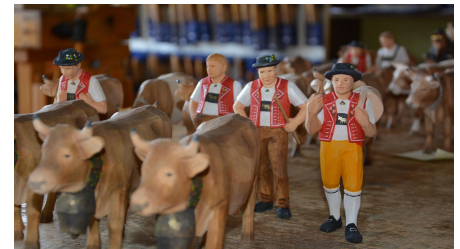
Appenzeller Alpaufzug - Figuren von Huggler Holzbildhauerei