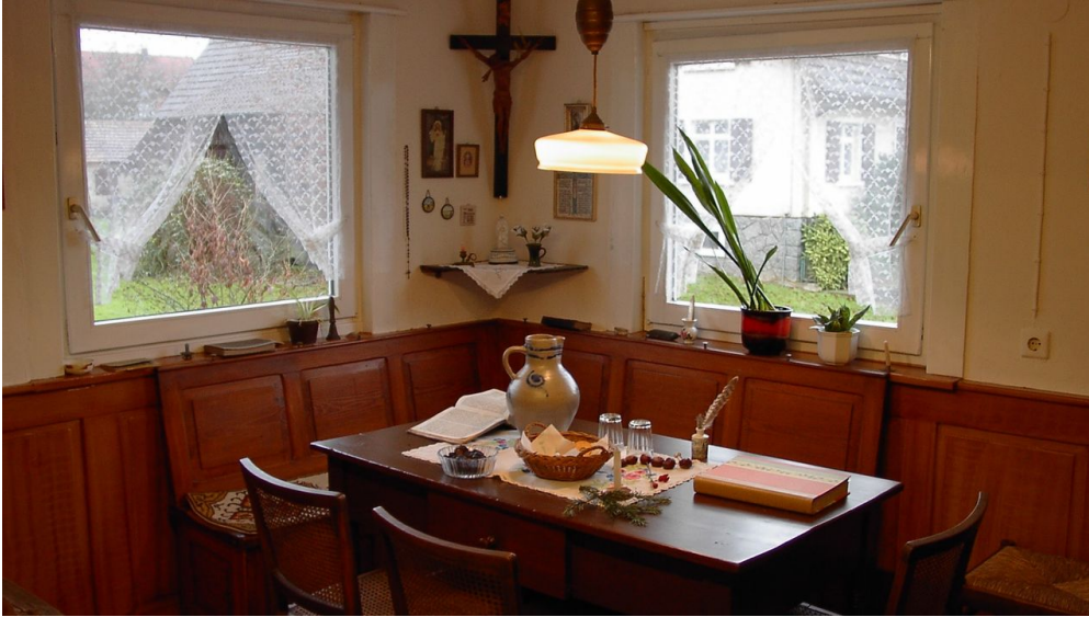
Heimatmuseum 2