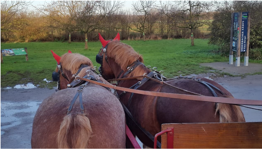
Kutschfahrt Reuter bei Haus Bürgel in Monheim am Rhein