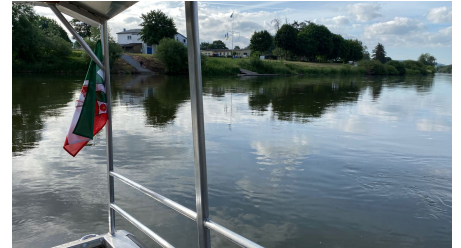
weserfaehre_hoexter_stephanberg_3.jpg - © Stephan Berg