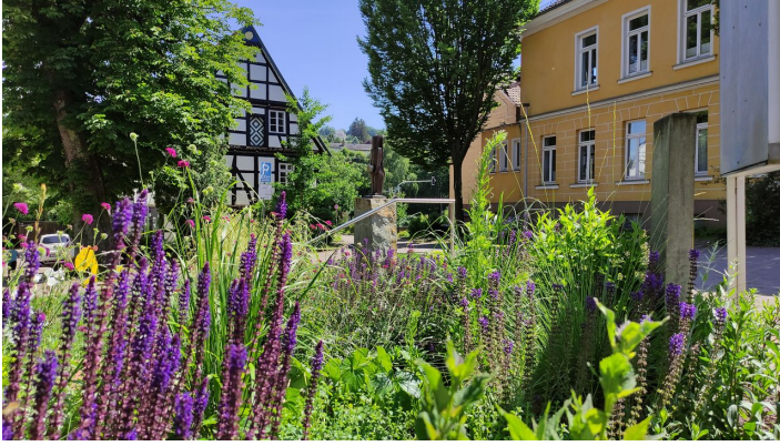
Die Wächterin.jpg