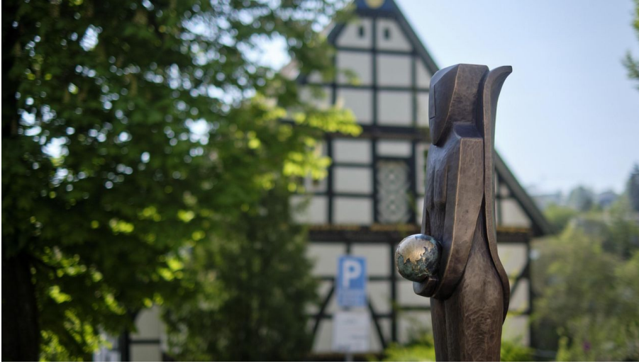
Die Wächterin