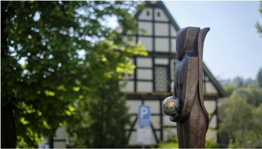
Die Wächterin