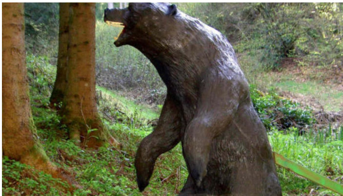
2058 - © Schützenverein Forbach