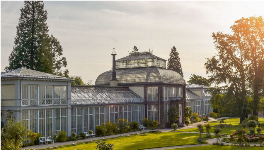
Stadt Kassel; Foto: Jörg Conrad

Kurfürst Wilhelm II. von Hessen-Kassel ließ 1822/23 das Große Gewächshaus errichten. Mit seinen besonderen Pflanzen ist es den ganzen Winter über eine Attraktion. Die Saison beginnt am 1. November und endet am 31. März.