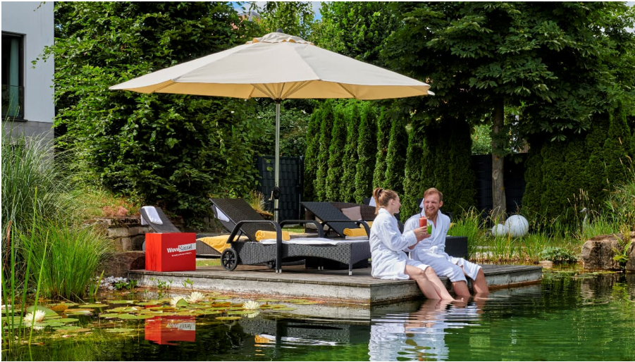
Schlosshotel Wellness.jpg