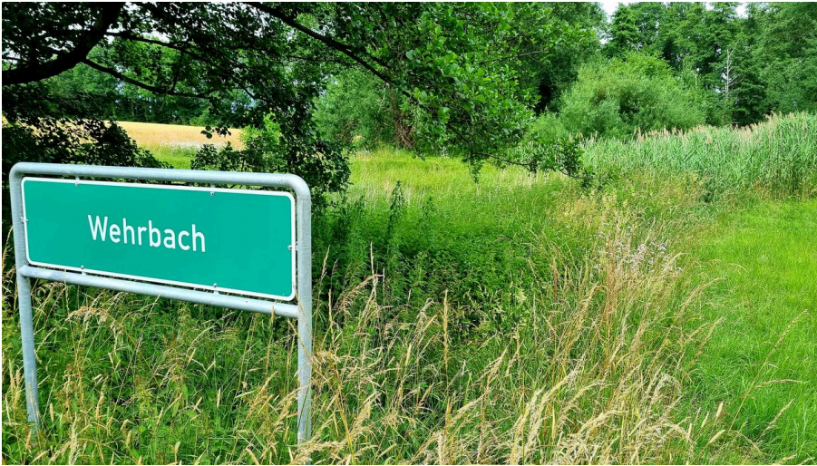
Wehrbach im Ortsteil Stukenbrock in Schloß Holte-Stukenbrock