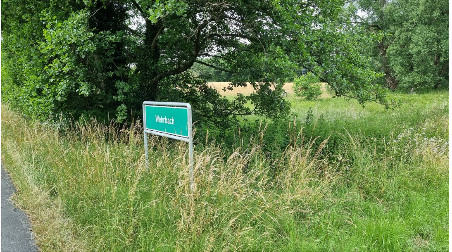
Wehrbach im Ortsteil Stukenbrock in Schloß Holte-Stukenbrock