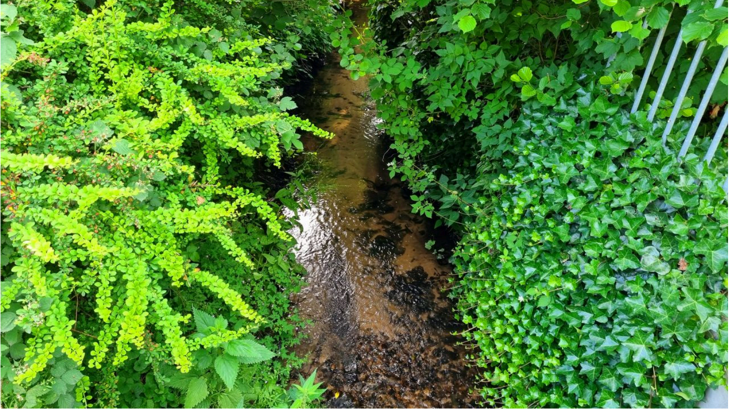
Menkebach im Ortsteil Sende in Schloß Holte-Stukenbrock