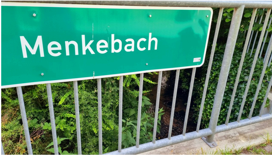
Menkebach im Ortsteil Sende in Schloß Holte-Stukenbrock