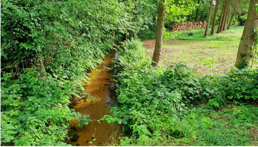
Rodenbach im Ortsteil Liemke in Schloß Holte-Stukenbrock