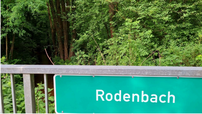
Rodenbach im Ortsteil Liemke in Schloß Holte-Stukenbrock - © Teutoburger Wald_Stadt Schloß Holte-Stukenbrock