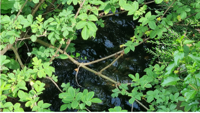
Ölbach in Schloß Holte-Stukenbrock