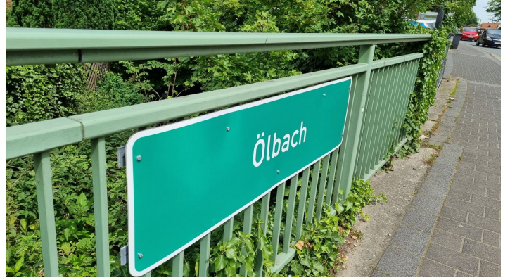
Ölbach in Schloß Holte-Stukenbrock