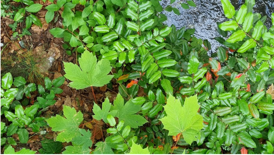
Ölbach in Schloß Holte-Stukenbrock