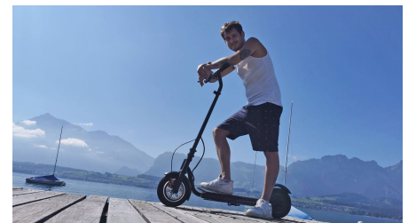
bee-scooter-interlaken-unterwegs-thunersee.jpg