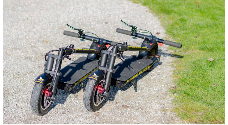
bee-scooter-interlaken-scooter-zusammengeklappt.jpg