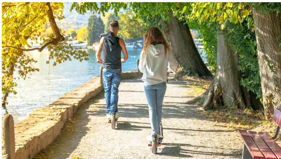
bee-scooter-interlaken-unterwegs-wasser.jpg