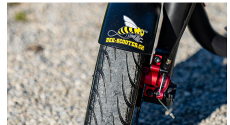
bee-scooter-interlaken-nahaufnahme.jpg