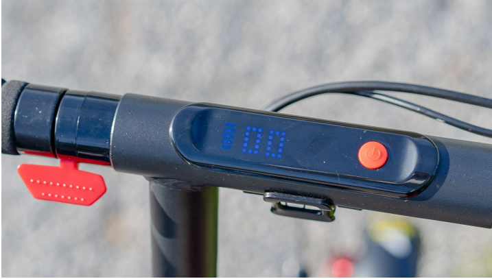
bee-scooter-interlaken-nahaufnahme-lenker.jpg