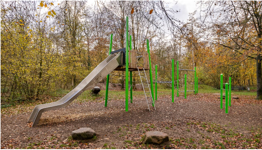
Kinderspielplatz am Wanderparkplatz Hinkesforst in Ratingen