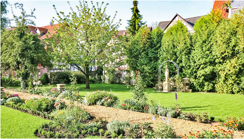
Peine_Kirche_Klostergarten.jpg