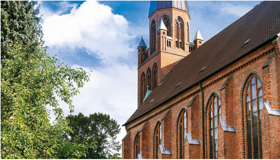
Peine_Kirche1.jpg