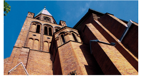
Kirche_Peine2.jpg