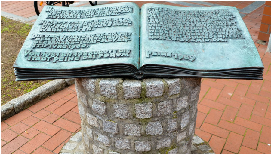
Bronzebuch_Winkel.jpg