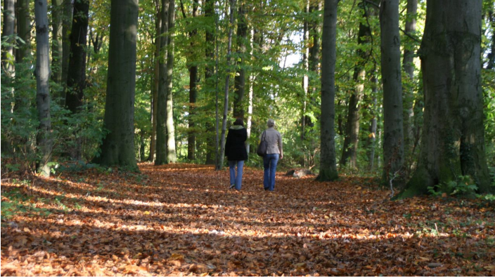
Peine_HerzbergHerbst.jpg