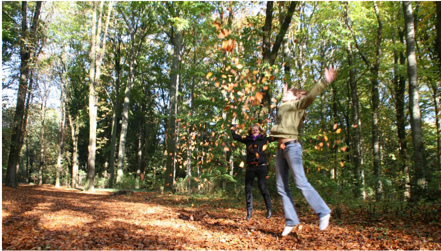
Peine_Herzberg.jpg