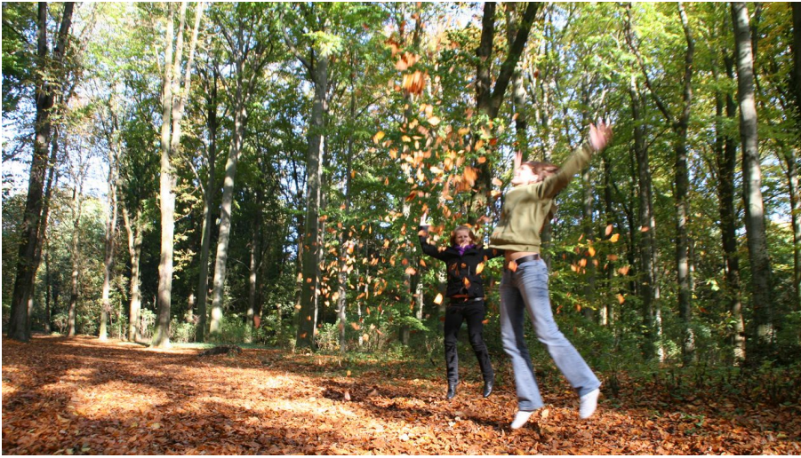
Peine_Herzberg.jpg