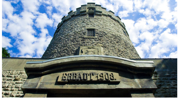
Peine_Herzberg_Turm.jpg