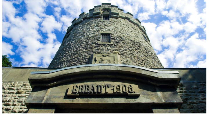
Peine_Herzberg_Turm.jpg