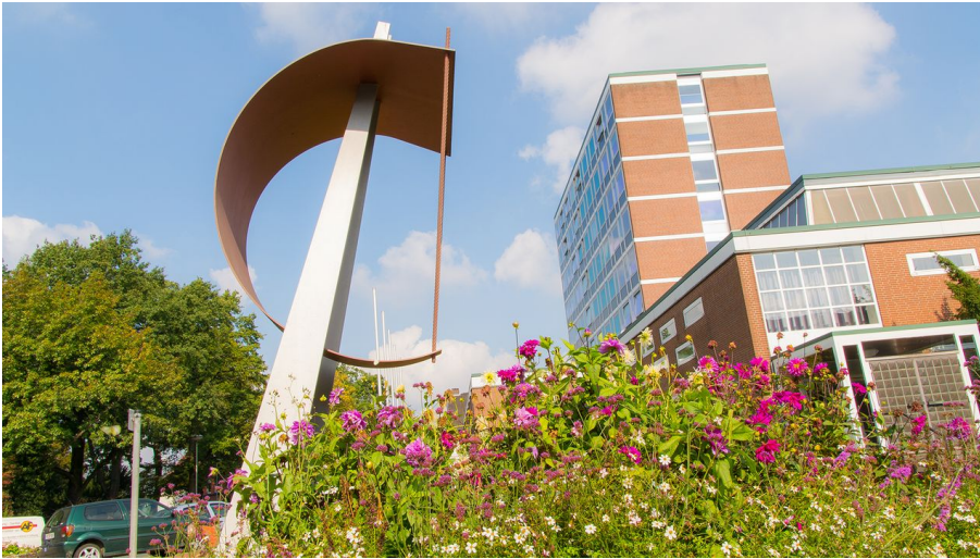
PE_Skulptur_P2.jpg