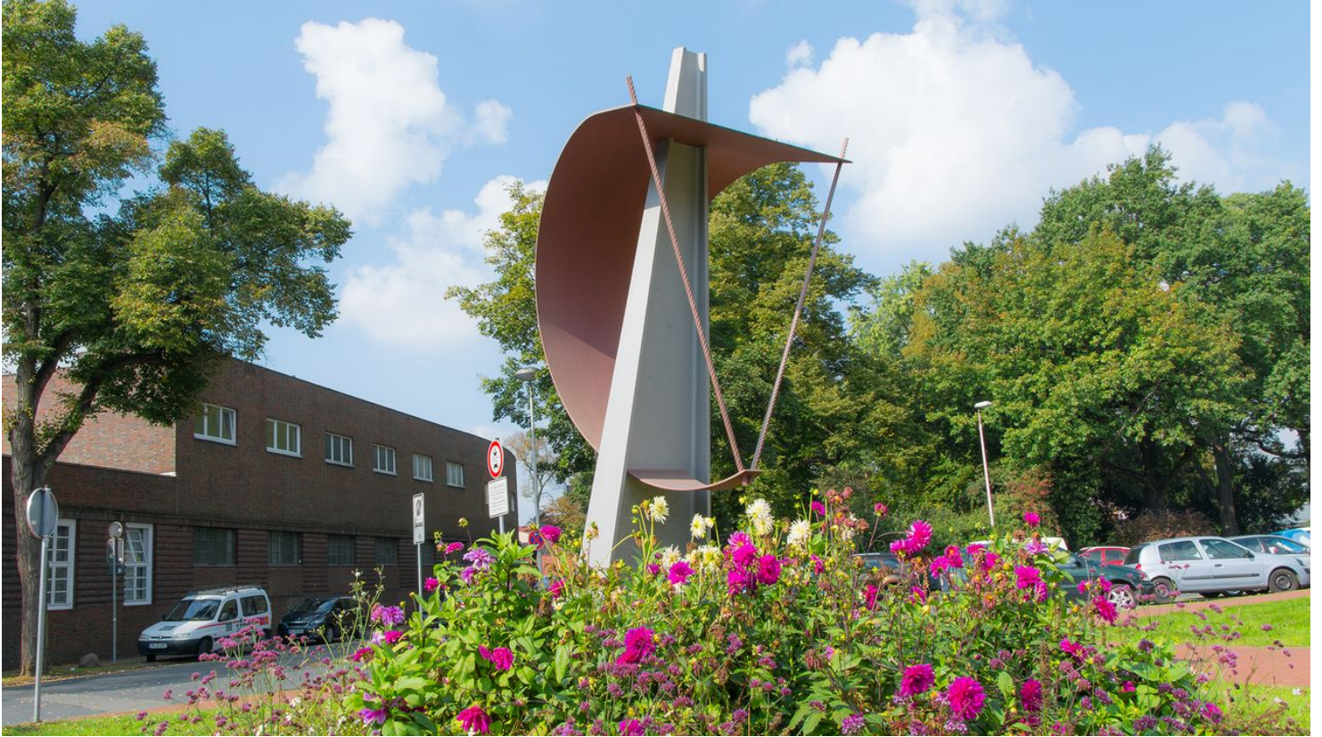
PE_Skulptur_P1.jpg