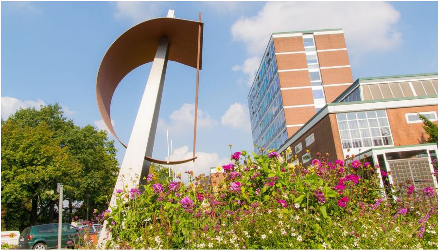
PE_Skulptur_P2.jpg