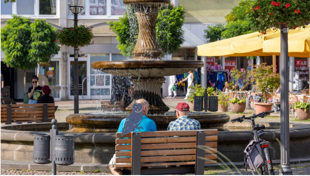
Marktplatz_08_2023_HUB_5.jpg - © christian bierwagen31224 peine