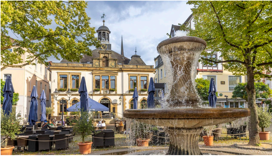
Brunnen_Altes Rathaus_2023_HUB_4.jpg