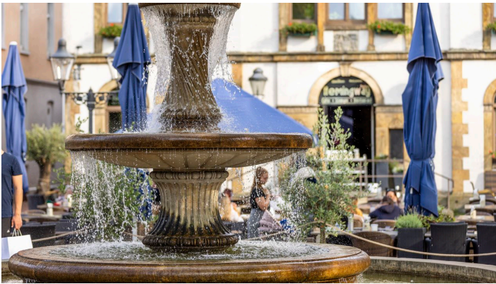
Brunnen_Altes Rathaus_2023_HUB_2.jpg