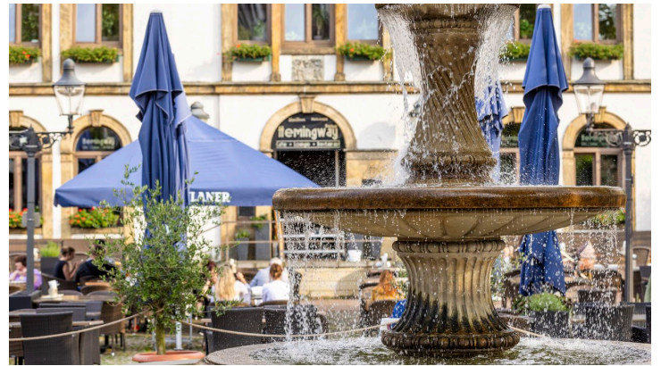
Brunnen_Altes Rathaus_2023_HUB_3.jpg