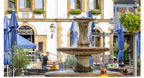
Brunnen_Altes Rathaus_HUB.jpg