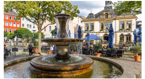
Brunnen_Altes Rathaus_2023_HUB_1.jpg