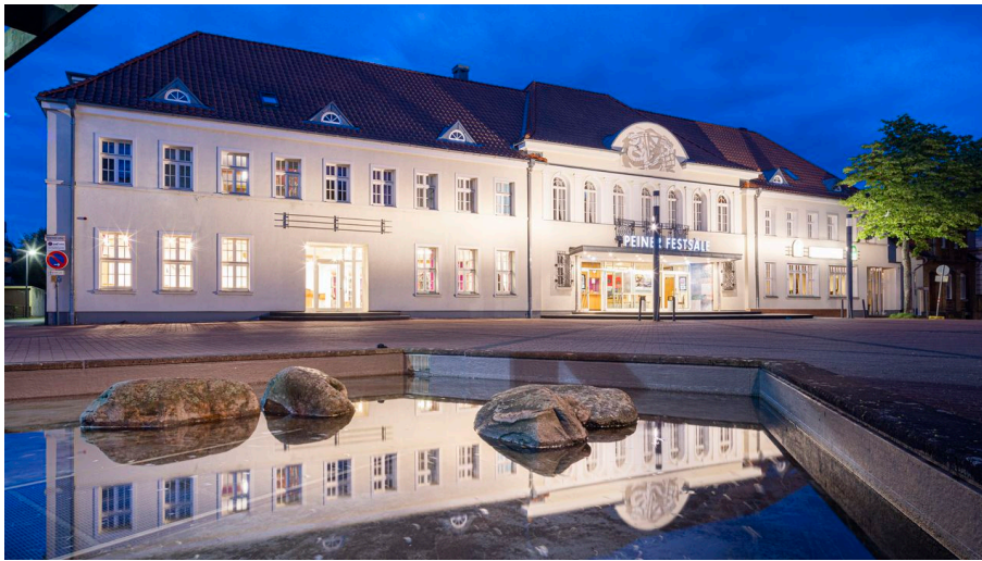
Peiner Festsäle_2023_@Christian Bierwagen (3).jpg - - welcome@peinemarketing.de