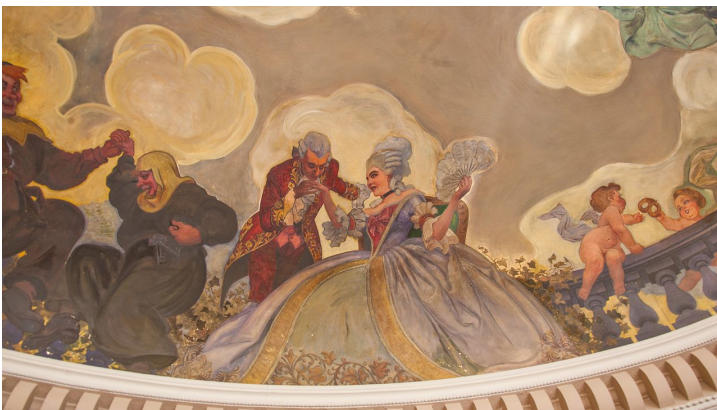
Peiner_Festsaele3.jpg