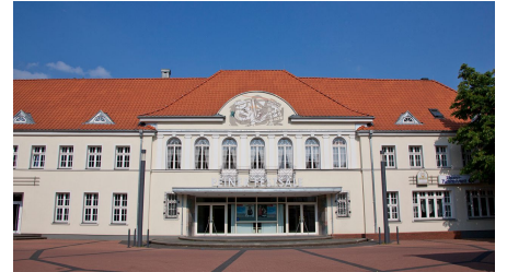
Peiner_Festsaele.jpg - - welcome@peinemarketing.de