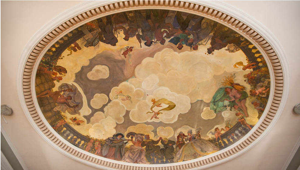
Peiner_Festsaele1.jpg

Quelle: destination.one ID: p_100166517 Zuletzt geändert am 25.09.2023, 12:28