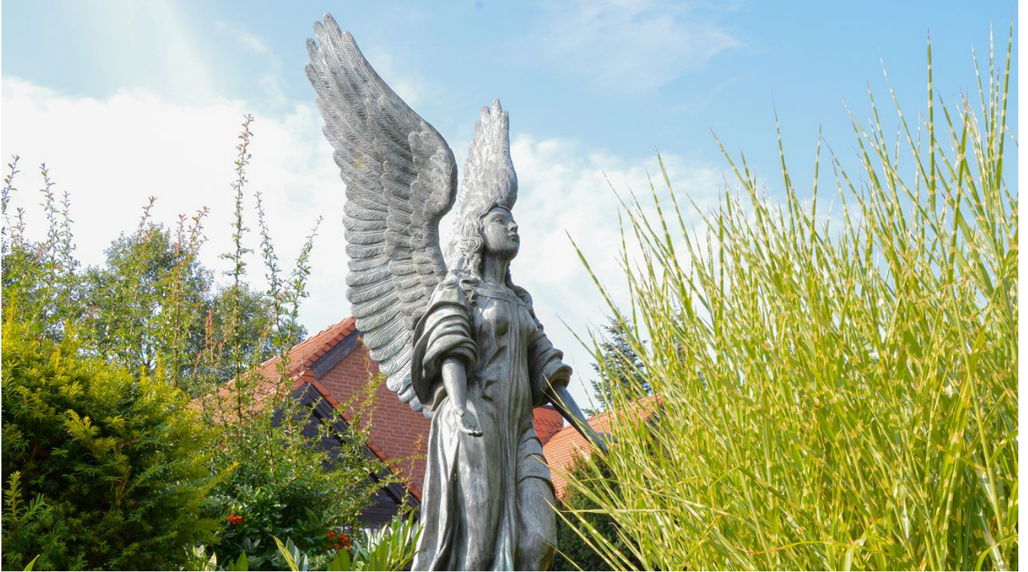
Bronzeengel2.jpg