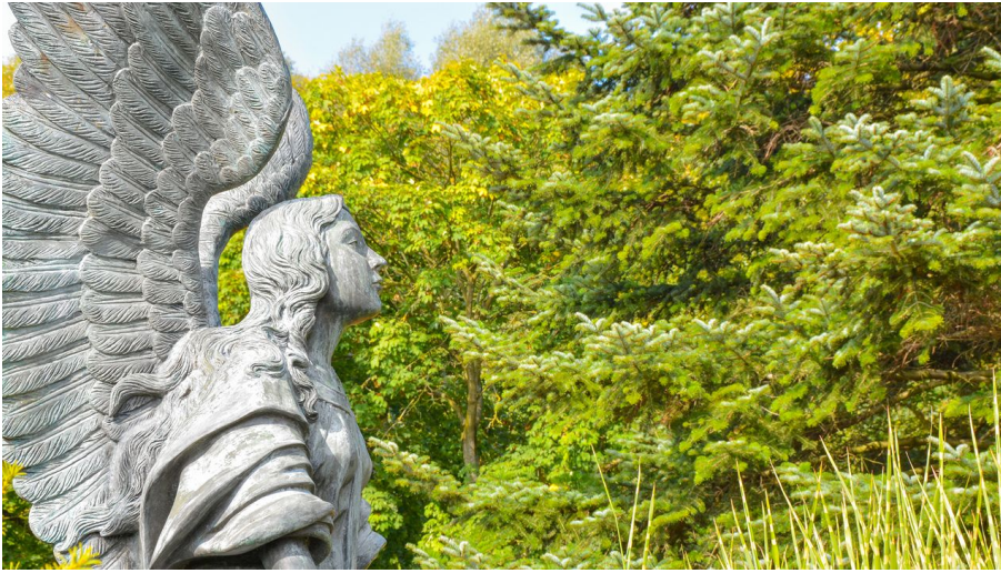
Bronzeengel1.jpg