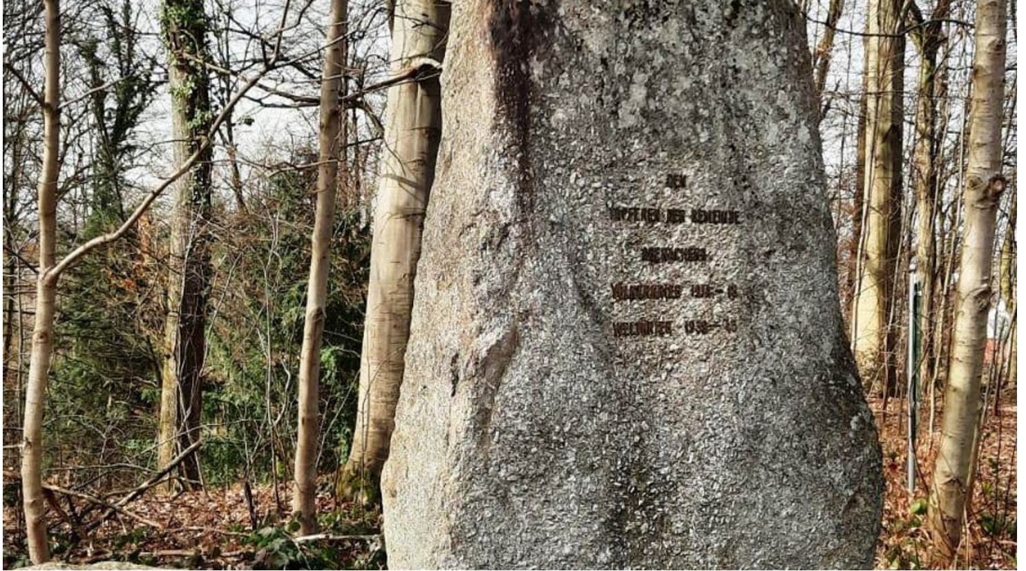
Heldenhain Gedenkstein