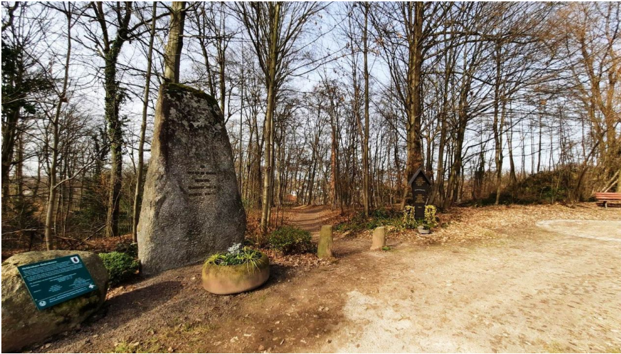
Heldenhain Gedenkstein 3