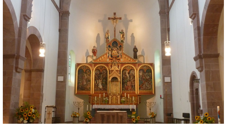
Pfarrkirche St Stefan Hochaltar