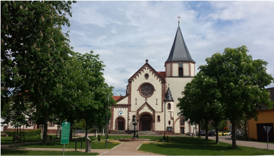
Pfarrkirche St Stefan