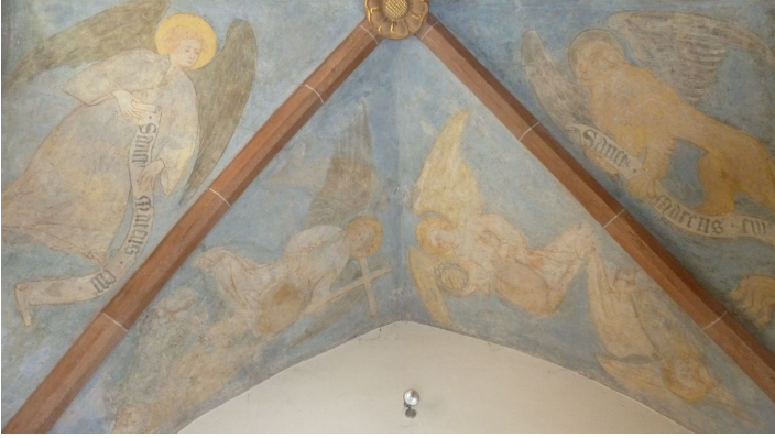
Taufkapelle Fresken